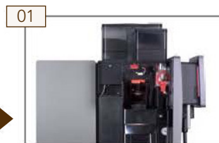
01 Tür öffnen.