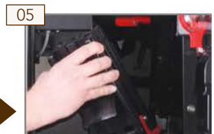
05 Brühmodul einsetzen.