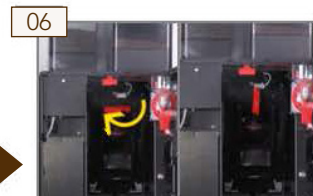
06 Brühmodul im Uhrzeigersinn verriegeln.

1-2 Mal wöchentlich sollte die Brüheinheit gereinigt werden. In den Bildern 01-06 sehen Sie, wie Sie die Brüheinheit ausbauen können. Spülen Sie diese anschließend unter fließendem Wasser ab.