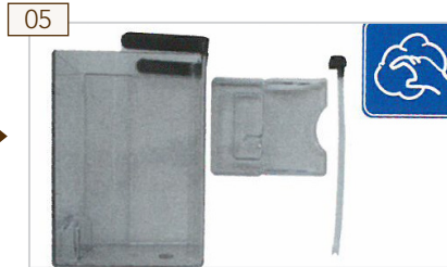
05 Milchbehälter und Ansaugschlauch reinigen.

Nach dem automatischen Reinigungsvorgang ist Ihre Maschine nun vollständig gereinigt.