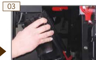
03 Brühmodul entnehmen.