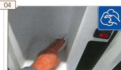
04 Innenraum des Kühlschranks und die Tür reinigen und trocknen.