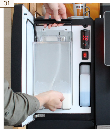
01 Tür öffnen. Milchbehälter entfernen und kühl stellen.