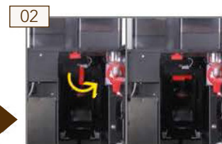
02 Satzbehälter entnehmen. Brühmodulverriegelung gegen den Uhrzeigersinn lösen.