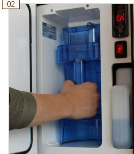
02 Reinigungsbehälter einsetzen.